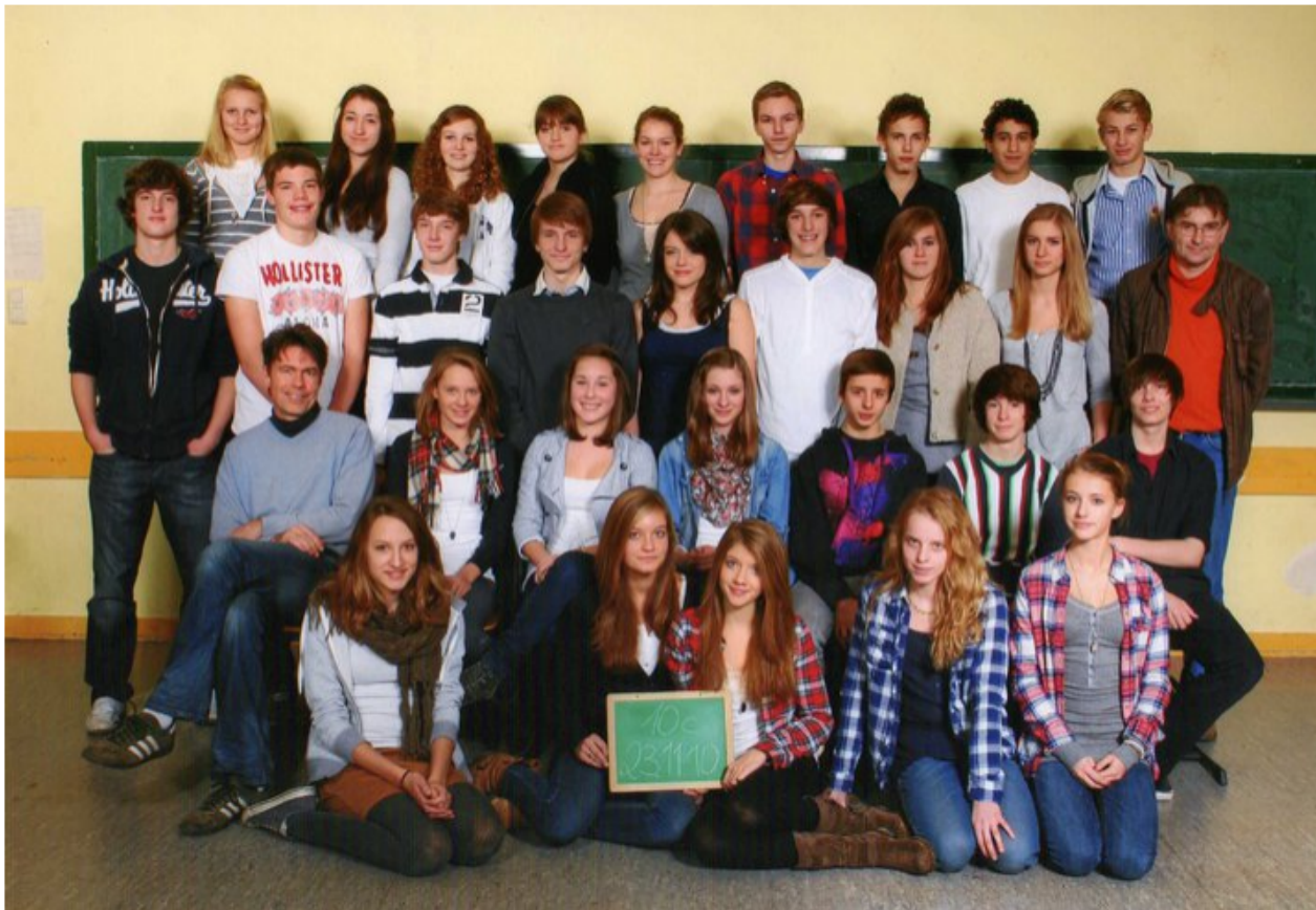
die gute 10c ;)